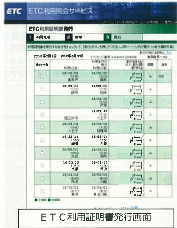
ETC利用証明書発行画面

ETC利用明細の表示、ETC利用証明書の発行、およびETC利用照会サービス（非登録型）で発行したETC利用証明書の明細確認等すべてのサービスが終了します。