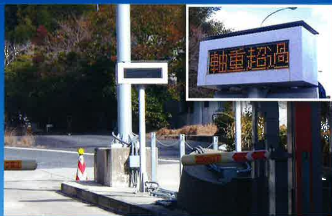
料金所での「軸重超過」表示